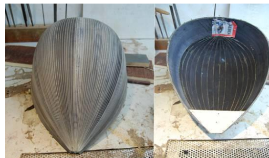
Σκάφος φαινομενικά 60άρι με 15 πραγματικές δούγες.

Σκάφος: Συχνά τα μπουζούκια αξιολογούνται με βάση των αριθμό των δούγων που φαίνεται να έχει το σκάφος τους. Δηλαδή ένα μπουζούκι με 60 δούγες είναι κατά πολύ ακριβότερο από ένα άλλο με 20. Διότι τάχα εξ' αυτού και μόνο του λόγου είναι ποιοτικά ανώτερο, πιο ωραίο και απαιτεί τις τριπλάσιες εργατοώρες για την κατασκευή του. Πρόκειται για ένα παλιό εμπορικό κόλπο-τέχνασμα εφόσον το κάθε 60άρι είναι εξωτερικά μόνο 60άρι και εσωτερικά 15άρι ή 20άρι όπως δείχνει και η φωτογραφία.